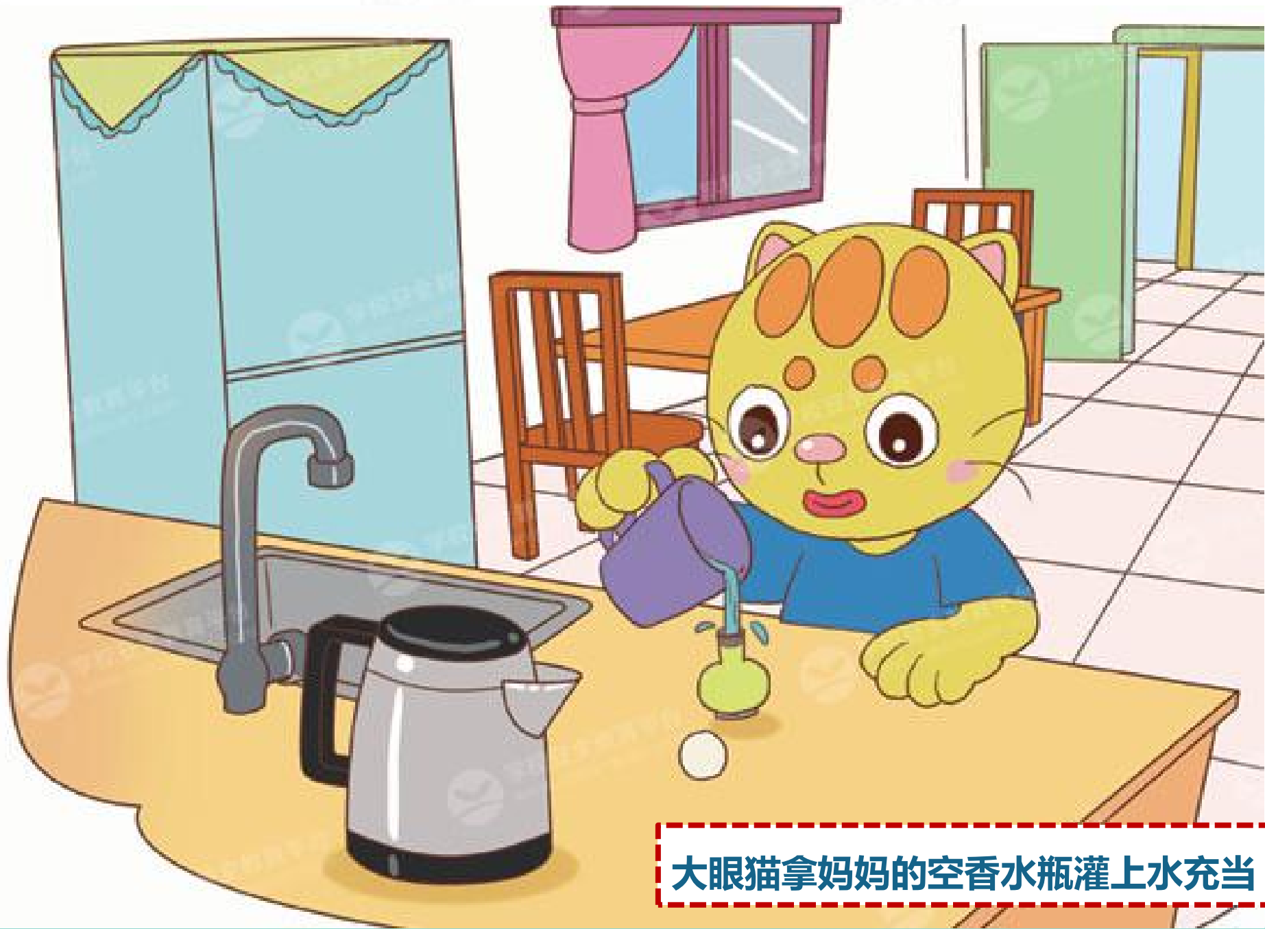
大眼猫拿妈妈的空香水瓶灌上水充当“药”。