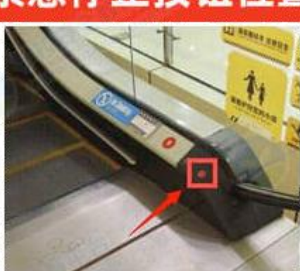
-电梯内侧盖板底部-