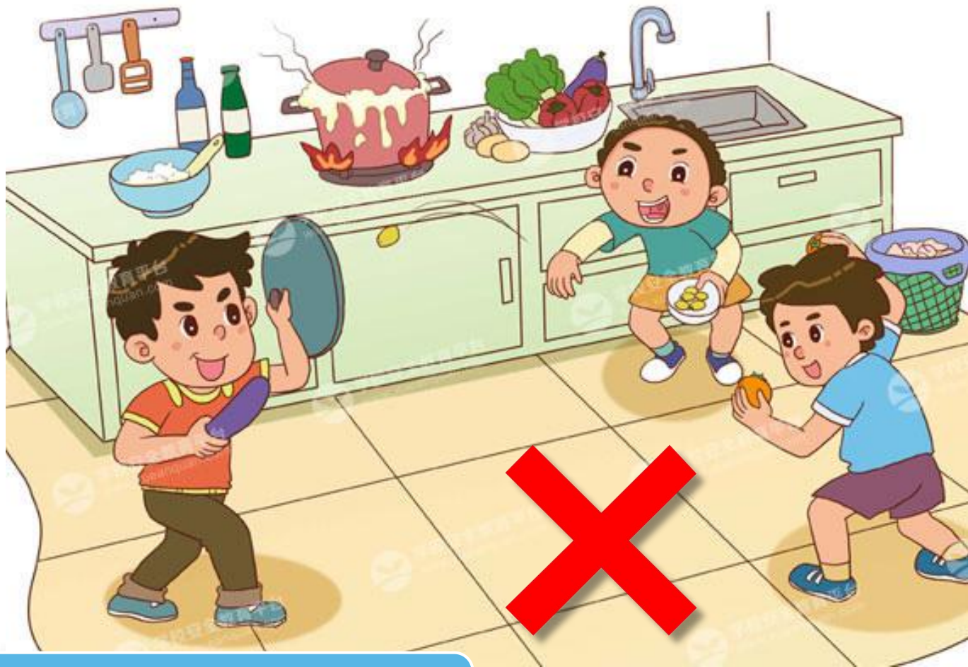
全全和小伙伴在厨房里打闹