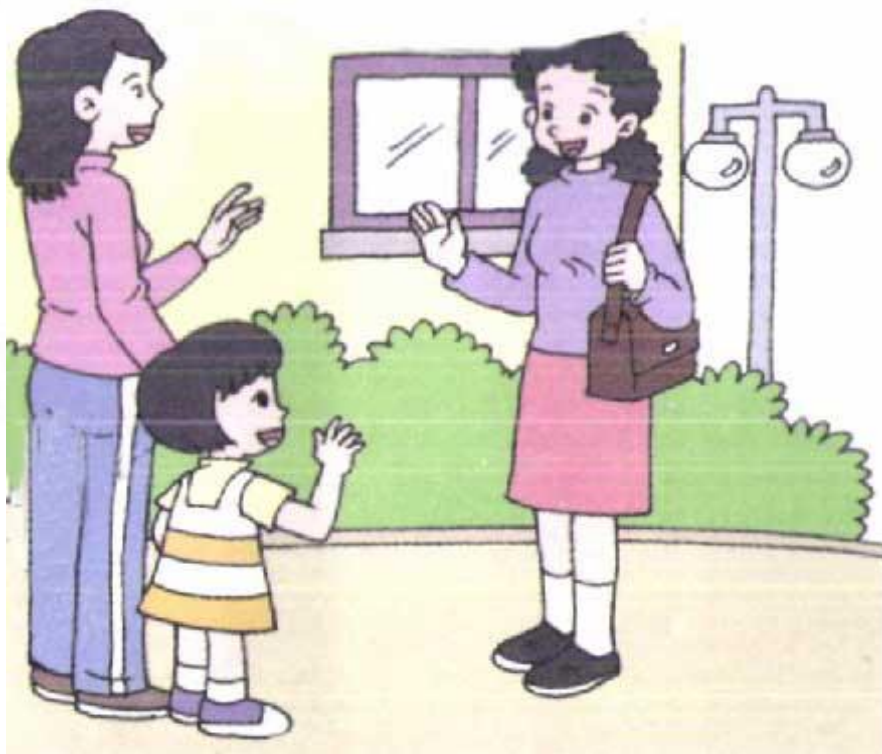
礼貌的问候与交流