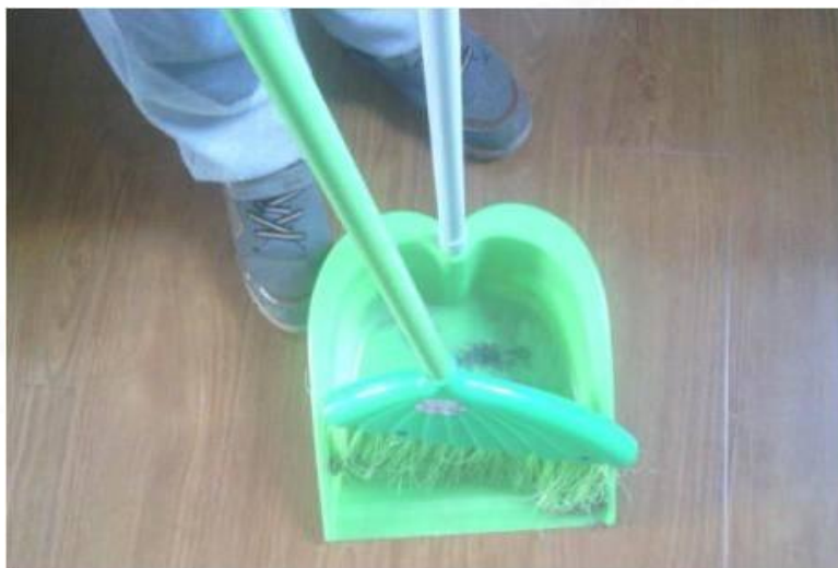
6.检查垃圾是否全部扫入畚箕