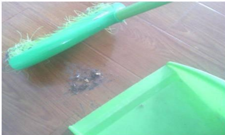
4.将垃圾扫为一堆，再扫入畚箕