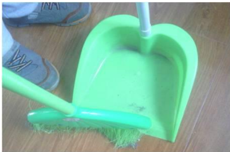
5.用扫把尖将剩余垃圾清扫入畚箕