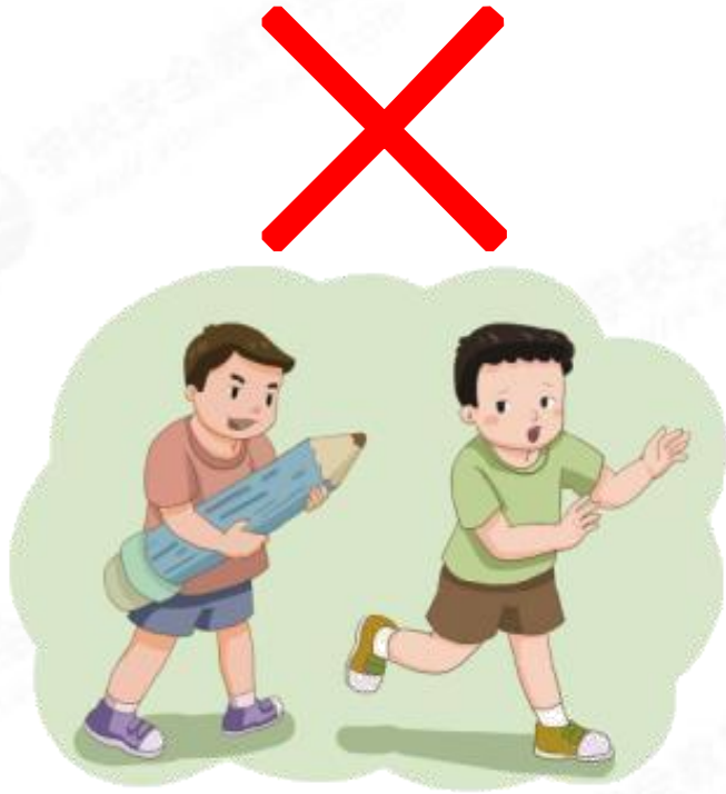
(拿铅笔对着人乱跑)