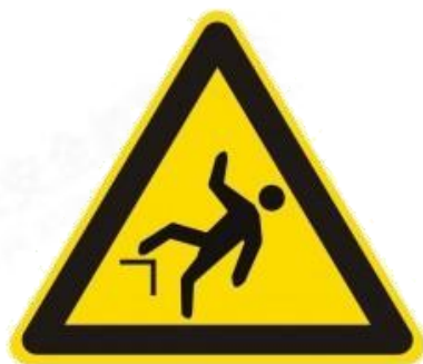
当心跌落 Caution, drop