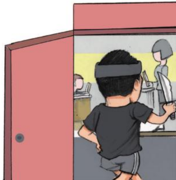
3.当歹徒靠近学生时