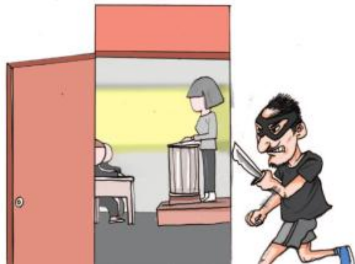
2.当歹徒从前门进入时