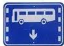
公交路线专用车道