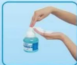
取适量洗手液于掌心

洗手在流水下进行，取下手上的饰物及手表，卷袖至前臂中段，如手有裂口，要用防水胶布盖严，打开水龙头，湿润双手。搓手步骤如图，每个步骤至少搓擦五次，双手搓擦不少于10-15秒种。双手稍低置，流水由手腕、手、至指尖尖冲洗，然后擦干。